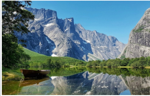
Norwegens atemberaubendste Wanderstrecke Romsdalseggen mit Aussichtsplattform Rampestrekken.