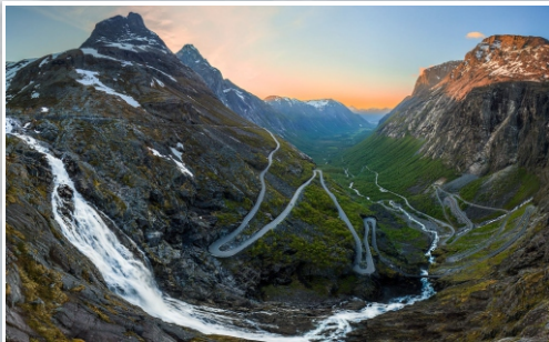
Trollstigen und UNESCO-Weltnaturerbe Geirangerfjord

Der kleine Ort Isfjorden ist idealer Ausgangspunkt für Ausflüge zu den schönsten und berühmtesten Sehenswürdigkeiten Norwegens, von denen einige direkt vor der Haustür liegen.